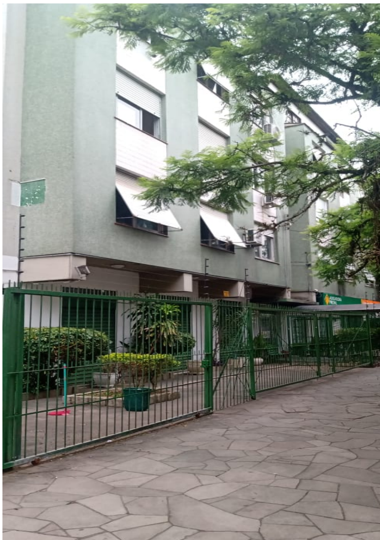
Figura 1: Vista externa geral