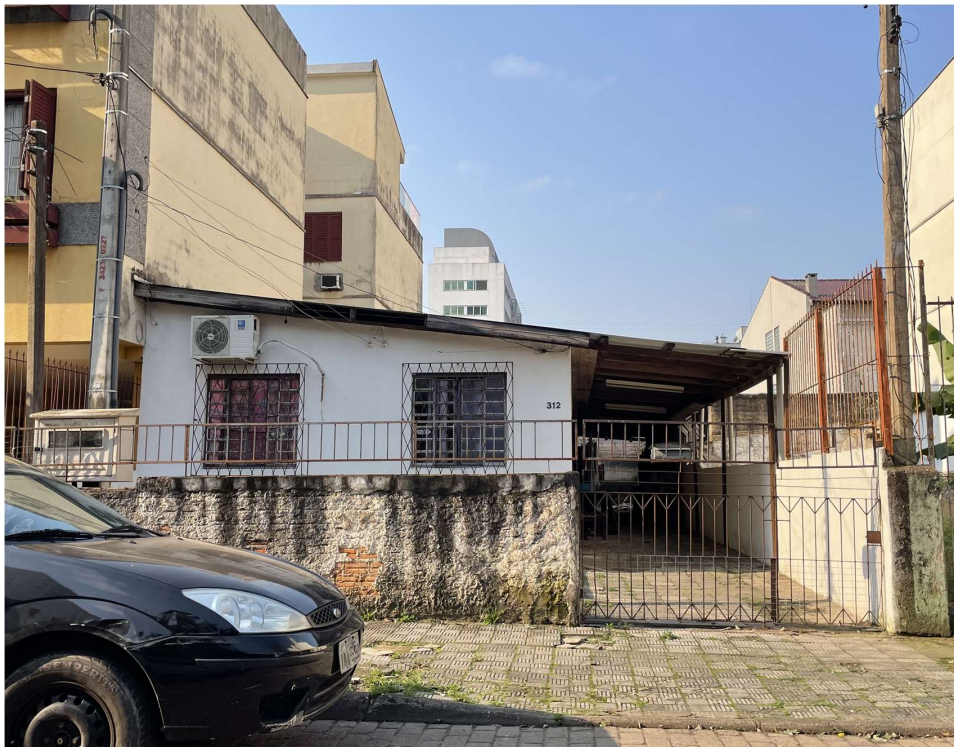
Figura 1: Vista fachada