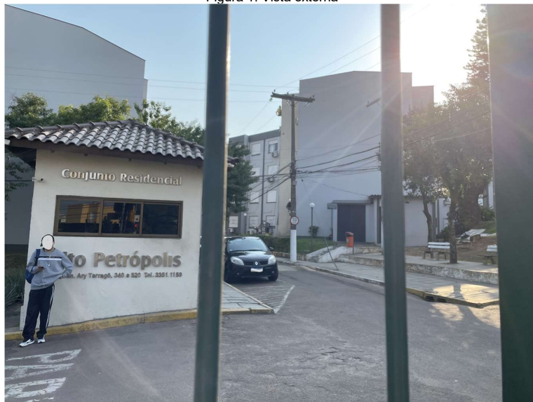
Figura 1: Vista externa