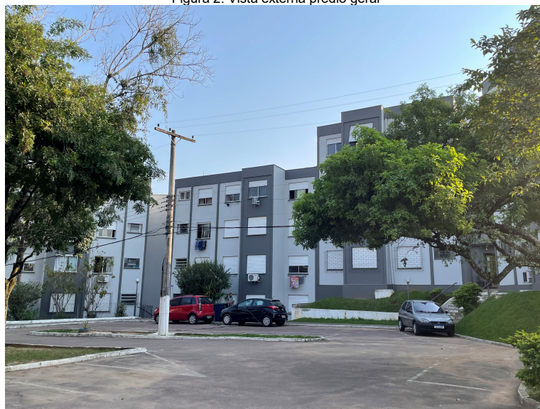
Figura 2: Vista externa prédio geral